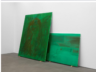
Die Arbeiten „Orange Tree“ (2026) und „The Barcelona Pavilion“ (2025).