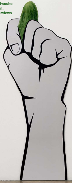
Die gereckte Faust zeigt: Es geht wieder los! Zur Art Week eröffnet Berlins angesagteste Kunstgruppe Slavs and Tatars eine Bar in Moabit. Statt Wein und Käse gibt es eingelegte Gurken, saure Drinks – und gesalzene Gespräche über Identität und Traditionen – mehr auf Seite 28